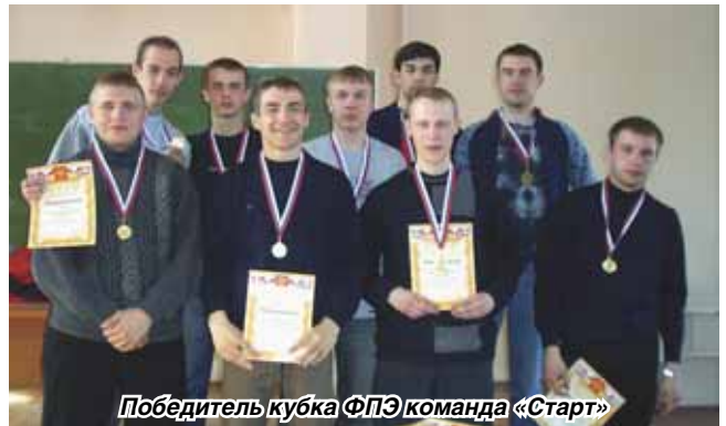
Победитель кубка ФПЭ команда «Старт»

В финальном же поединке сошлись «Вымпел» и «Старт». Матч проходил под диктовку последних. «Старт» выглядел явно предпочтительнее, его комбинации были оригинальнее и изобретательнее, передвижения – стремительнее. Яркой демонстрацией такого превосходства может служить итоговый счет встречи – 11:5 в пользу «Старта». Красивая победа и заслуженное звание чемпиона факультета промышленной энергетики по футболу, что, в принципе, неудивитель-