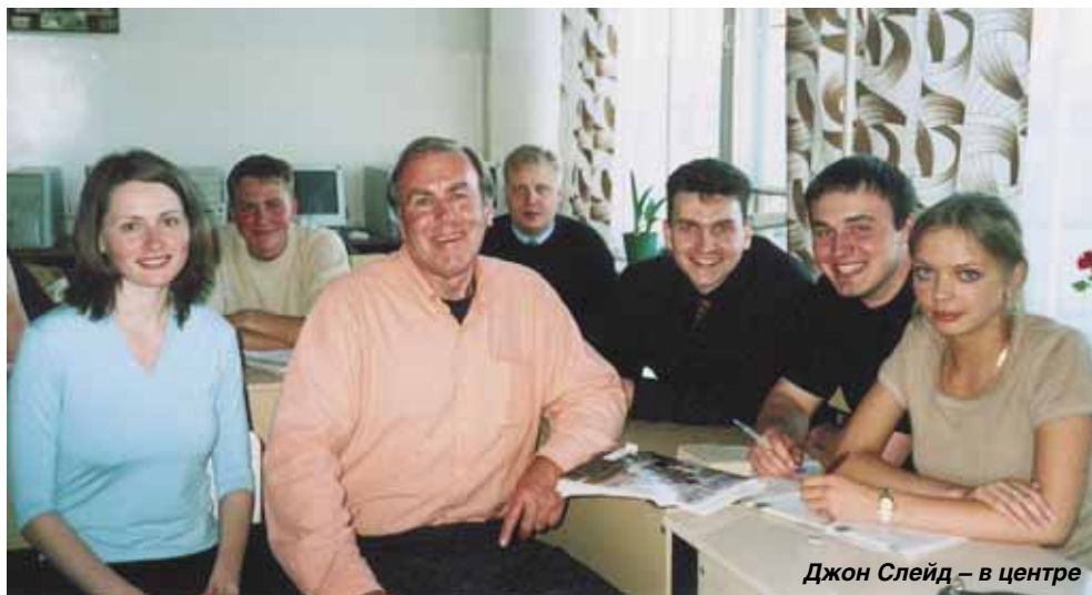
Джон Слейд – в центре

Уже несколько лет АГТУ совместно с норвежским университетом г. Будё предлагает бизнес-образование по программе МВА. Учебный процесс предусматривает визиты ведущих преподавателей из Норвегии и других стран для проведения занятий на английском языке. Российская часть программы предполагает изучение курса «Деловой английский». Дважды в год приезжает преподаватель из США Джон Слейд, он известный писатель и литературовед. Занятия проводятся в деловой и творческой обстановке, в форме живых дискуссий. Затрагиваются вопросы политики, культуры, экономического и социального развития. Различия в менталитете и бизнес-культурах стран мира является одним из основных препятствий в налаживании и поддержании бизнес-контак-